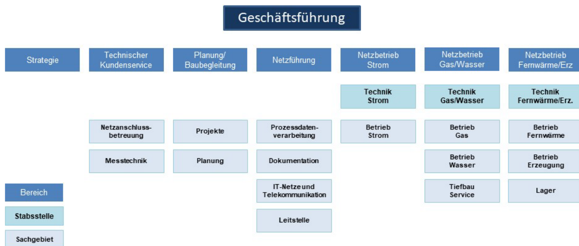
Abbildung 2 Organisation der Stadtwerke Jena Netze (Stand 31. Dezember 2022)

Die Aufgaben der Leitung und Letztentscheidung für die Stadtwerke Netze werden vollständig durch eigenes Personal erfüllt.