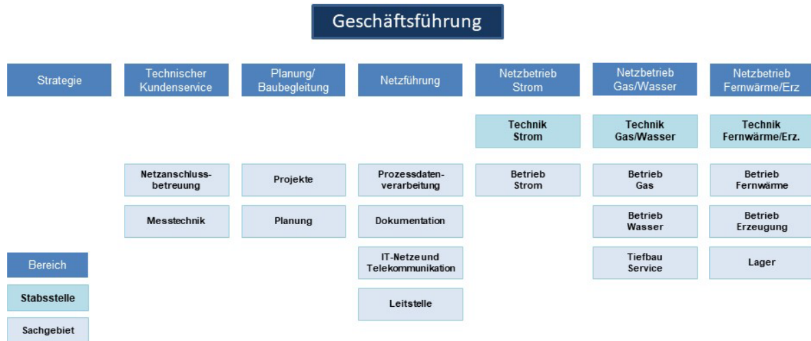
Abbildung 2 Organisation der Stadtwerke Jena Netze (Stand 31. Dezember 2024)

Die Aufgaben der Leitung und Letztentscheidung für die Stadtwerke Netze werden vollständig durch eigenes Personal erfüllt.